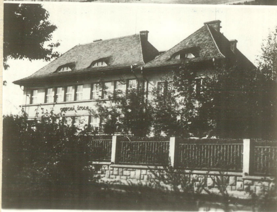
Obecná škola v Bystřici u Teplic - Šanova

Pohlednice školy, které byly dáány ve šk. r. 1946-47 do prodeje.